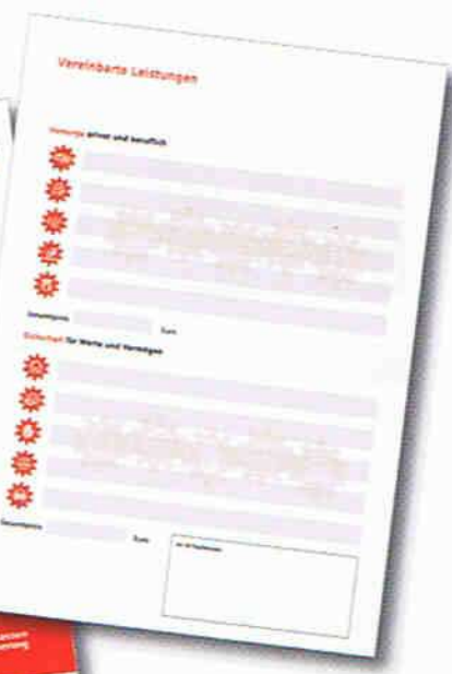
Angebot mit Leistungsübersicht

Wünsche“ und „Versorgungslückenbogen“. Vereinbaren Sie dann mit Ihren Kunden, welche Lücken für ihn existenzbedrohlich sind, welche er nicht selbst tragen kann und/oder tragen möchte und somit abdecken muss. Verwenden Sie zur Darstellung der Risiken die passenden Verkaufshilfen. Diese können Sie als Komplettsatz ebenfalls über die SEG Plattform (Beform bestellbar).